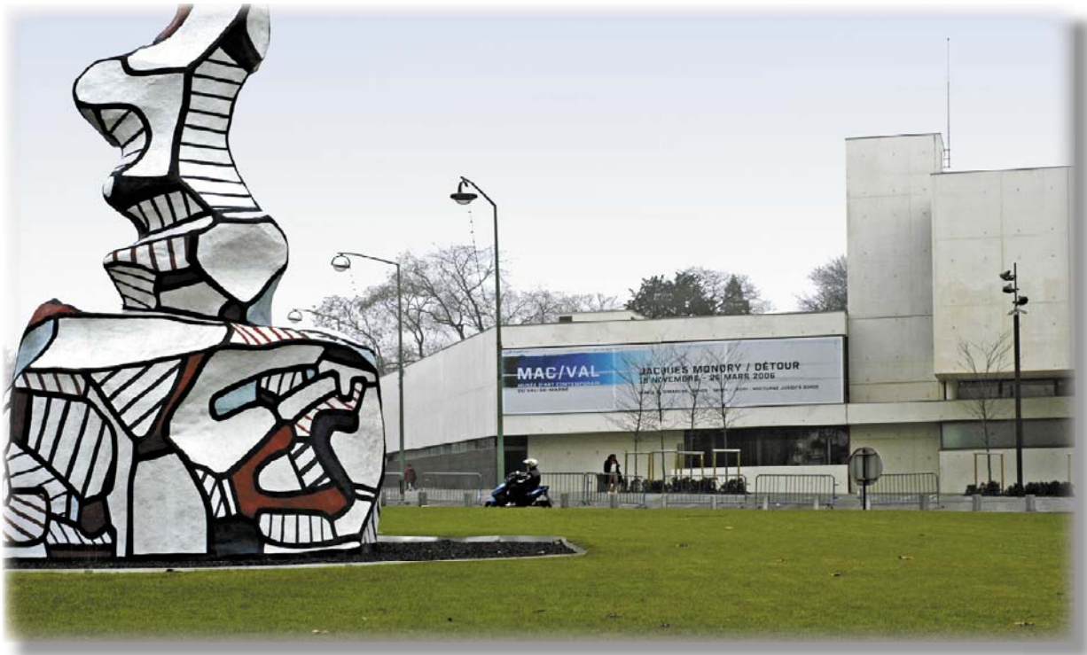
Musée d'art contemporain du Val-de-Marne